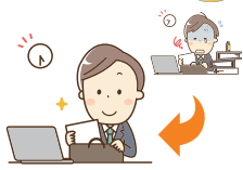
年次有給休暇取得率と休暇に関する満足度

社員の生活時間には労働時間だけではなく、仕事以外の自由時間や家族とのふれあいの時間等様々な生活の時間があります。長時間労働や休日出勤、休暇が取得できない状態などが続くと、労働時間への満足度や休暇取得の満足度が下がっていただけではなく、自身の健康状態に対する不安も増大します。